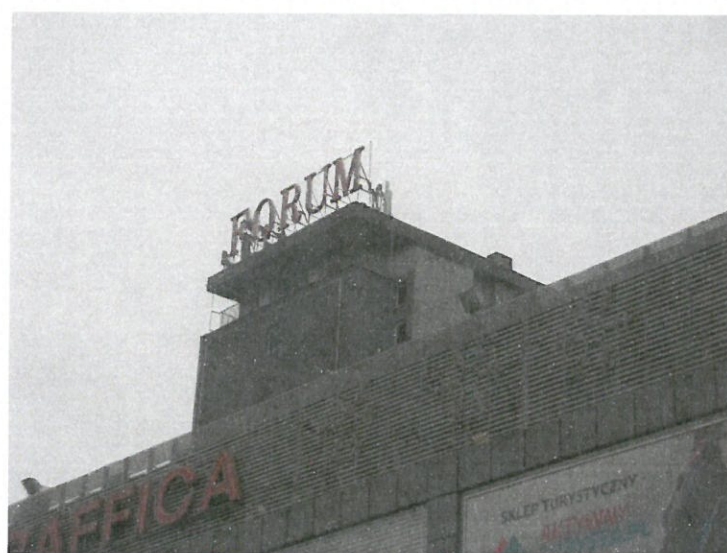
Zal. nr 1: Widok ogólny instalacji radiokomunikacyjnej.